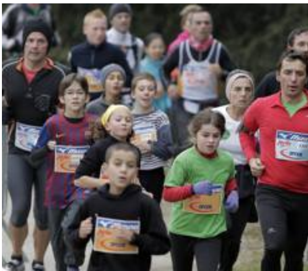
■ Des petits, des grands. Il y en avait pour tout le monde hier au Parc de Miribel Jonage

Quatre pages à découvrir dans notre cahier services